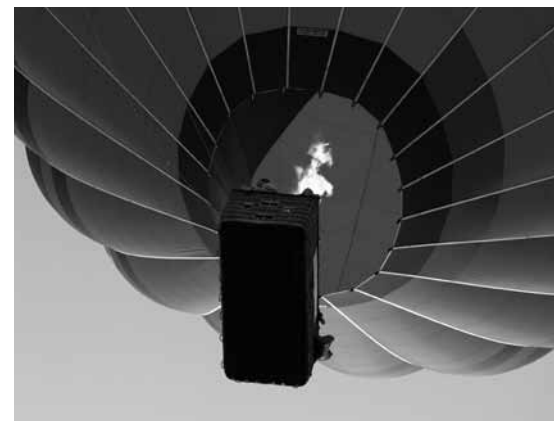
Total revidiertes MWST-Gesetz: weniger Ballast dank mehr Spielraum.

Der Vorsteuerabzug wurde vollständig überarbeitet. Grundsätzlich besteht nun für jede unternehmerische Tätigkeit ein Anspruch auf Abzug der Vorsteuer. Im Gesetz finden sich keine Formvorschriften mehr für den Vorsteuerabzug. Er ist zulässig, wenn das betroffene Unternehmen nachweist, dass es die Vorsteuer bezahlt hat. Neu sind die Vorsteuern für Ver-